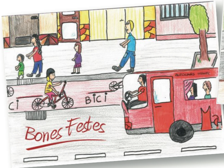
Eva Planes - Escola el Sitjar de Linyola