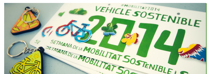
Imatges 3a cursa escolar de mobilitat a Lleida

La bici va resultar el mitjà de transport guanyador en tots els trajectes de la cursa, amb una velocitat mitjana de 10 km/h i el trajecte amb cotxe privat fou 4 vegades més car que el trajecte en bus, suposant a més, el doble d'emissions de CO 2 i de partícules PM10.