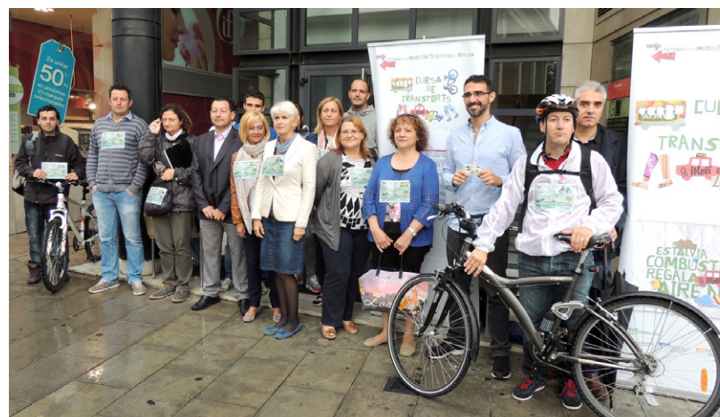
Imatges 4a cursa de Transports de l'Àrea de Lleida

En temps de viatge porta a porta en els municipis més propers (fins a 10 Km) el bus triga entre 5 i 6 minuts més que el cotxe i en municipis de major distància, com Balaguer (30 Km) tarda uns 15' més. Les diferències en temps són per tant molt baixes si tenim en compte que el cotxe és entre 7 i 17 vegades més car que l'autobús en l'accés a Lleida. Per calcular els costos es repercuteixen tots els costos reals; imputant les despeses d'amortització del vehicle i tres euros d'aparcament; i considerant l'ús de la T10/30 integrada, el títol de transport més utilitzat a l'Àrea de Lleida, que suposa un 64%