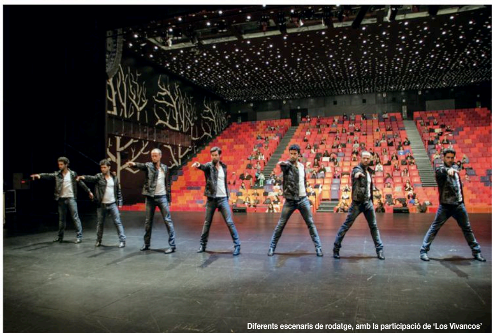
Diferents escenaris de rodatge, amb la participació de 'Los Vivancos'