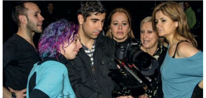
Durant la gravació del vídeo amb professors d'escoles de dansa de les Terres de Lleida

El vídeo promocional compta amb la col·laboració especial de la companyia dels germans ballarins 'Los Vivancos', que actuaran al Teatre de la Llotja de Lleida el proper 11 de maig.