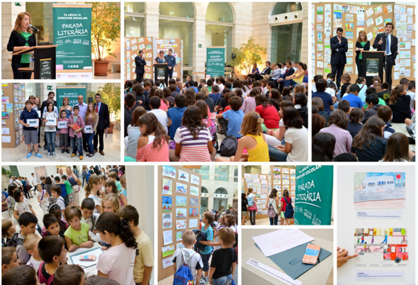
Imatges del lliurament de premis de la I Edició del Concurs Escolar 'Parada Literària'