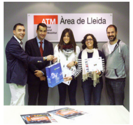
Lliurament dels premis de la II Edició del Concurs de Curtmetratges 'RECREA'

El curt guanyador es pot visualitzar a través del canal Youtube de l'ATM.