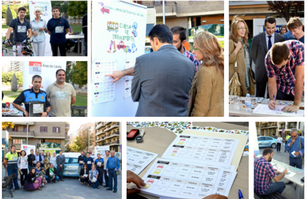
Imatges | Cursa escolar de Mobilitat a Lleida

La cursa ha servit per determinar que per moure's per poblacions properes, com Alpicat, el mitjà idoni és la bicicleta. El participant que anava amb bicicleta va arribar 7 minuts abans que el cotxe i va estalviar 6 € i 1.200 grams de CO2. D'altra banda, pels trajectes de recorregut més llarg, el bus competeix clarament amb el cotxe privat. Així a Alfarràs per exemple, el bus va tardar només 8 minuts més que el cotxe, però va estalviar 11 € i un 50% de consum energètic.