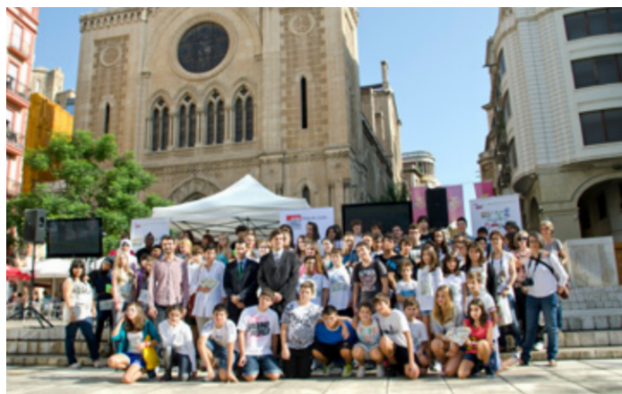
Imatges I Cursa escolar de Mobilitat a Lleida

La bici va ser el mode triomfador en els dos casos, amb un temps de 18' des de l'INS Guindàvols i de 10' des de l'INS Joan Oró. El bus competeix clarament amb el cotxe i amb només una cinquena part del seu cost. Els centres participants van destacar la importància que a les escoles i instituts es difonguin i treballin de manera pedagògica i amena els hàbits, valors i avantatges del transport sostenible per desplaçar-se per les ciutats.